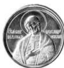
медаль Александра Невского