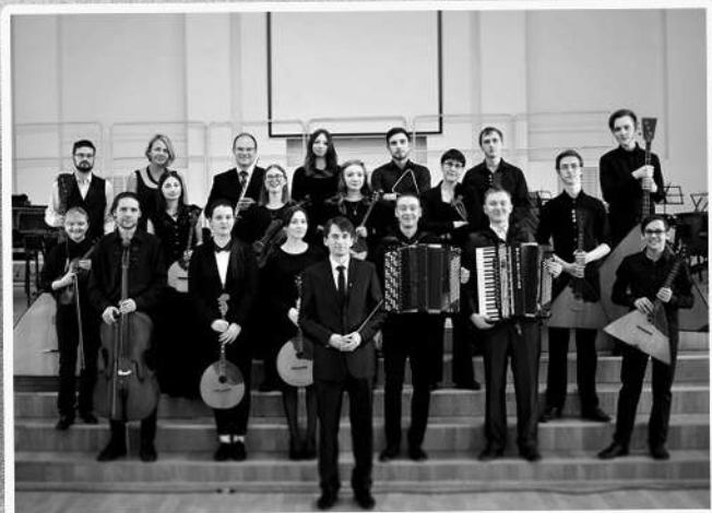
Оркестр народных инструментов