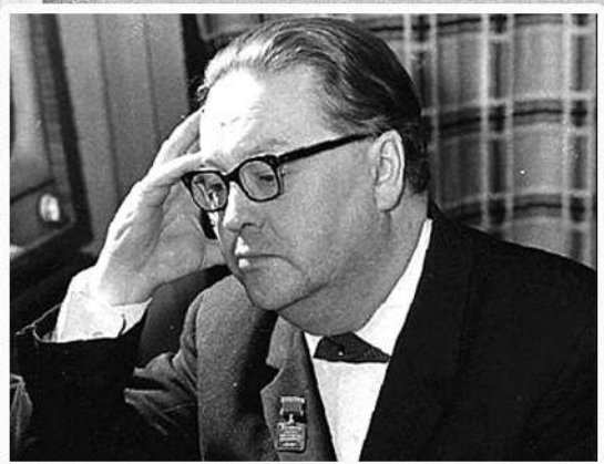
Народный артист СССР, композитор Гельмер Синисало