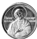
медаль Александра Невского