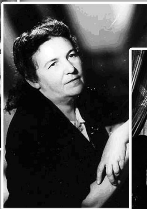
40-е годы XX века