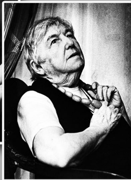
90-е годы XX века

На протяжении долгих лет маминой жизни к нам в дом постоянно приезжали из разных концов страны и мира люди, которые интересовались творчеством Гумилева и Серебряным веком русской культуры – она осталась одной из тех немногих, кто лично знал почти всех выдающихся поэтов и прозаиков, помнил многие подробности