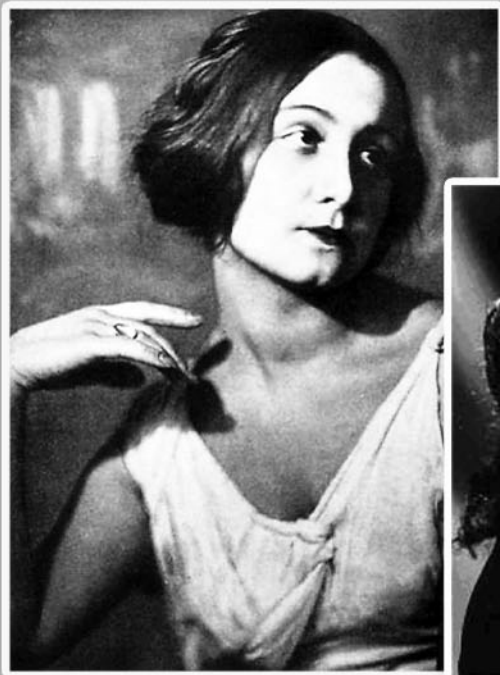
20-е годы XX века