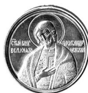
медаль Александра Невского