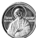
медаль Александра Невского