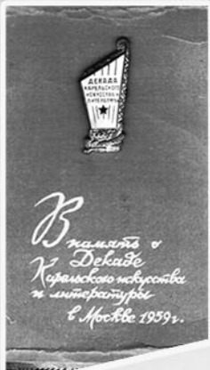
Знак декады Карельского искусства в Москве — 1959 год