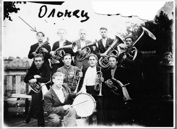
Олонцу джаз банд. 1949 год