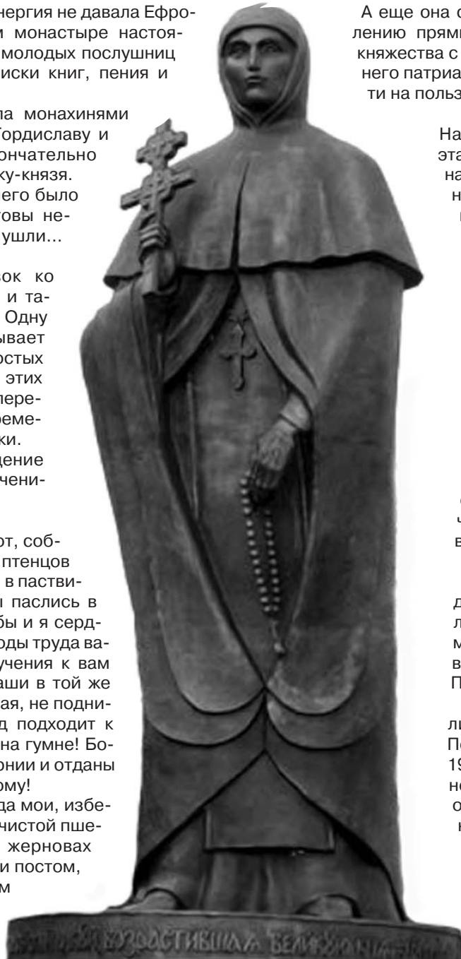
Памятник Ефросинье Полоцкой

В 1187 году ее мощи были перевезены в Киево-Печерский монастырь, а в 1910 году – в Полоцк, в основанный ею Спасо-Преображенский монастырь, который в честь нее и назван Спасо-Ефросиньевским.