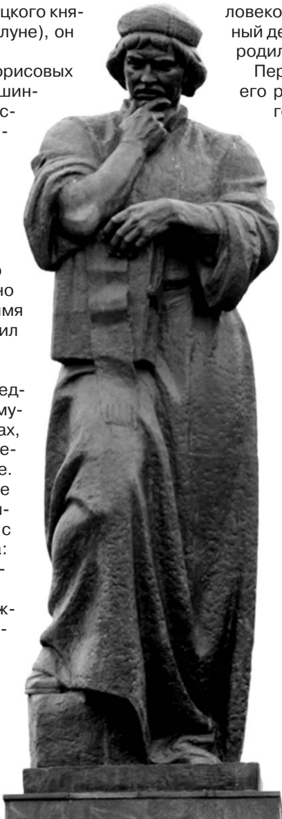
Памятник Франциску Скорине

Здесь же можно увидеть и старинный печатный станок, и даже воссозданные келью монаха-переписчика книг с самим мо-