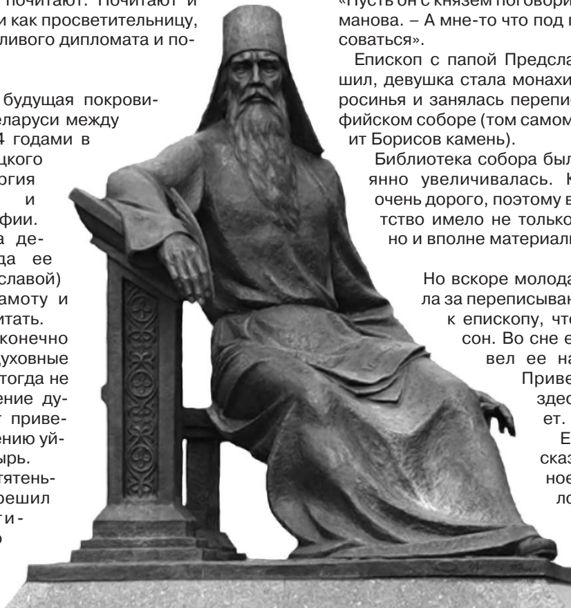
Памятник Симеону Полоцкому

Епископ тут же рассказал, что нечто подобное в ту же ночь приснилось и ему, и благословил Ефросинью на