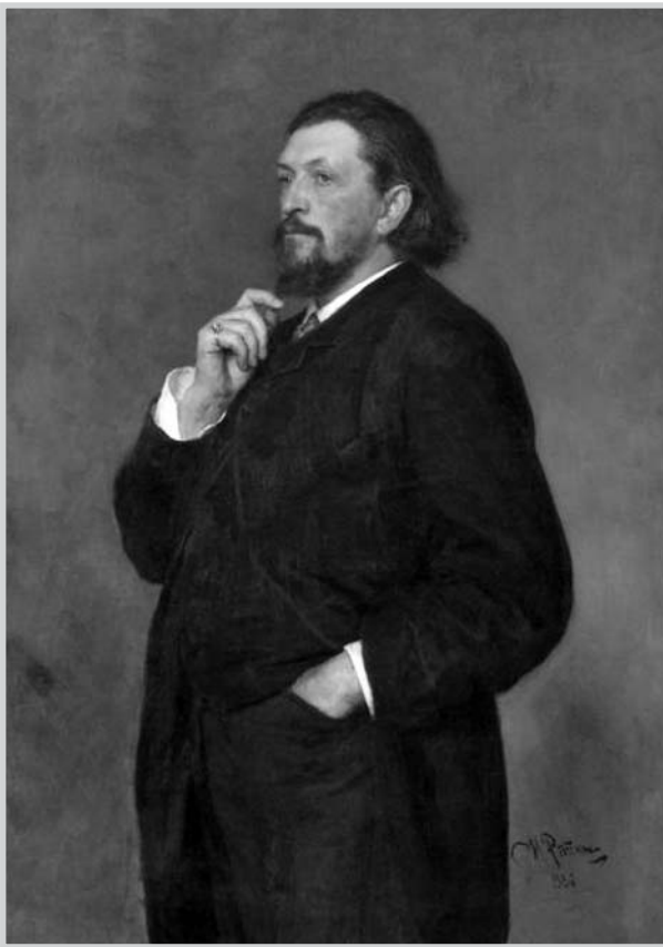
И. Е. Репин. Портрет музыкального деятеля М. П. Беляева. Холст, масло. 1886. Гос. Русский музей

ние исправить на пользу отечественной культуры.