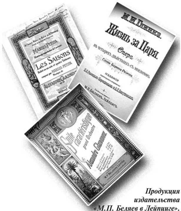
Продукция издательства «М. П. Беляев в Лейпциге».

Беляев регулярно вывозил в Европу молодых русских композиторов, знакомил с музыкальным миром, выдающимися представителями западной